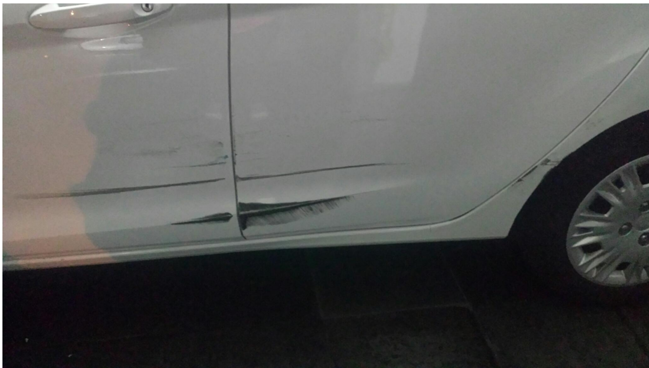
FOTO ACIDENTE 1

***** FIM DOS ANEXOS: O RESTANTE DA PÁGINA DEVE SER INUTILIZADO. *****